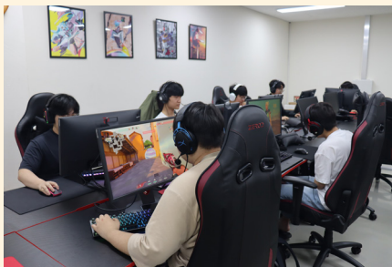
e스포츠 실습실 (아레나)