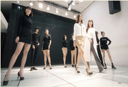
모델 실습실 (아라모드)