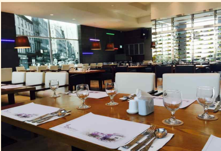
호텔경영, 호텔조리 실습실 (42번가)